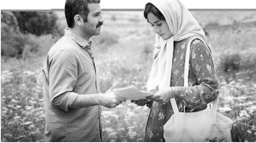
«ملاقات خصوصی» در جشنواره فیلم فجر، بهار ۱۳۹۰