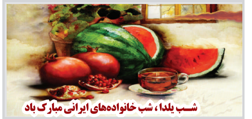
شش یلدا، شب خانواده‌های ایرانی مبارک باد